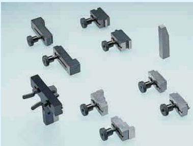
ESU aksesuarları ayar çeneleri/ölçüm uçları