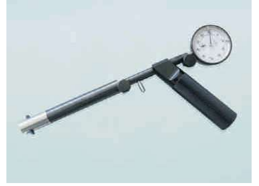
ON-OD Kanal Ölçümü