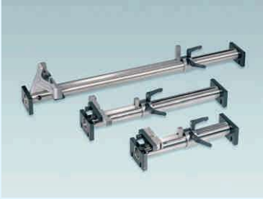
ESU 510/290/160 yatay ekseninde ayar cihazı

Ayar çeneleri tutucu gövde, bir çift ayar çenesi, master blok kalitesinde tungsten karbür ölçüm uçları, kilitleme ünitesi, master blok hariç tahta kutusundadır.