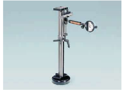
ESU dikey ölçüm ekseninde ayar cihazı

Talep üzerine diğer markalara ait silindirik komparatörleri için özel modeller