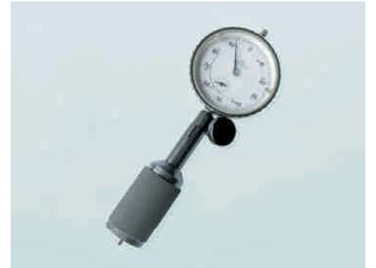
FLM Pah Uzunluk Ölçüm Cihazı