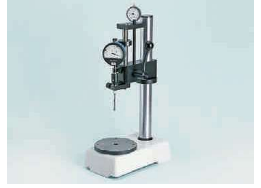
OSIMESS uçlu OSM 5 ölçüm standı