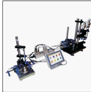
M-BUS girişleri ile prob ve komparatörlerin bağlanması