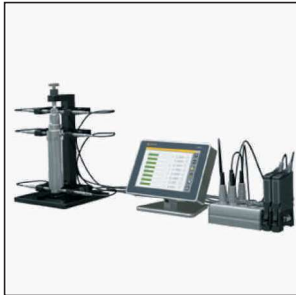
M-Bus giriş ile bağlanan prob lar