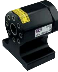
200045 alfa-clamp 45 takım tutucu olmadan 8X45° indekslenir