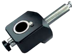
Takım Tutucu VDI (DIN 69880) 200516 VDI 16 200520 VDI 20 200525 VDI 25 200530 VDI 30 200540 VDI 40 200550 VDI 50