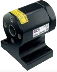
200090 alfa-clamp 90 takım tutucu olamadan 4X90° indekslenir