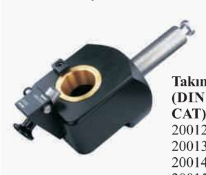
Takım Tutucu SK (DIN / MAS-BT / CAT) 200120 SK / ISO 20 200130 SK / ISO 30 200140 SK / ISO 40 200150 SK / ISO 50