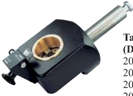
Takım Tutucu HSK-A (DIN 69893/1) 200225 HSK - A 25 200232 HSK - A 32 200240 HSK - A 40 200250 HSK - A 50 200263 HSK - A 63 200280 HSK - A 80 200210 HSK - A 100