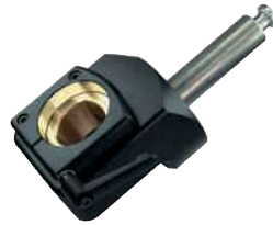
Takım Tutucu Capto 200303 Capto - C3 200304 Capto - C4 200305 Capto - C5 200306 Capto - C6 200308 Capto - C8