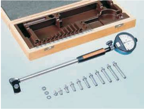
SUBITO® SU 50 - 100