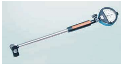
SUBITO® Tutucu Gövde