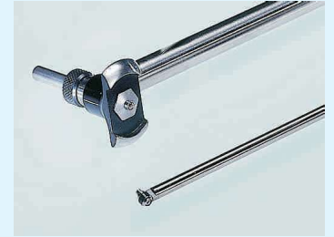
SUBITO® SU 4,5-6 ve SU 35-60